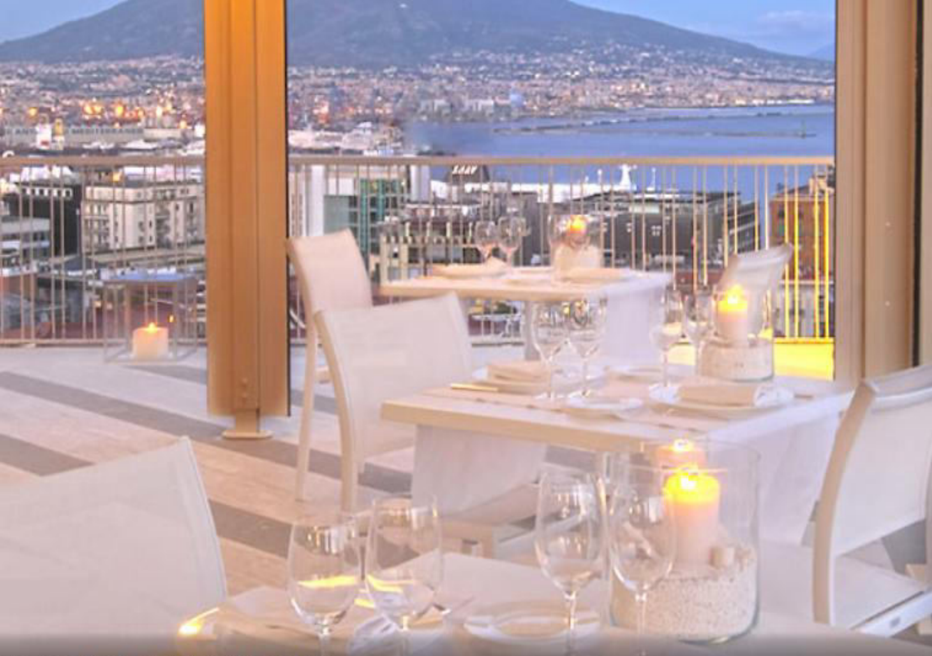
terrasse Angiò sur le toit (44 de 58)